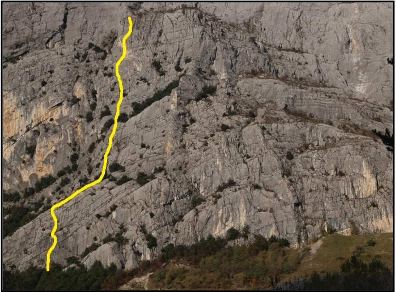
"Il paradiso può attendere" – tracciato